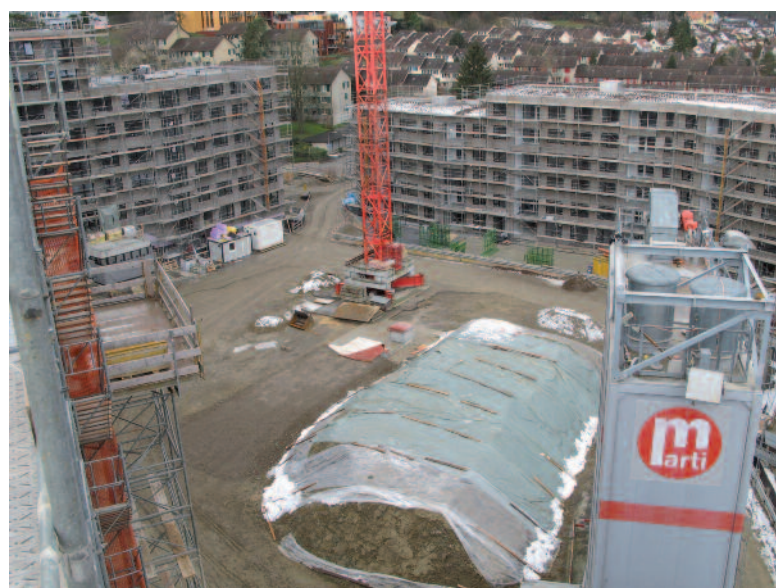
Plafonierter Innenhof nach Abtransport der Bohranlage im Januar 2011.