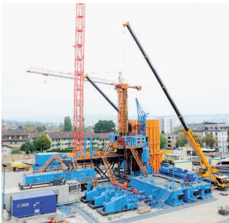
Installationsplatz der Geothermiebohrung im zukünftigen Innenhof der Baugenossenschaft Sonnengarten im September 2009.

Ab dem 19. März 2010 wurde die gesamte Geothermie-Bohranlage sukzessive demontiert und nach Waldkraiburg in Deutschland zu ihrem nächsten Einsatzort transportiert. Der mobile, rund 100 Tonnen schwere Bohrturm trat seine Reise am 28. April an; am 7. Mai 2010 war die gesamte Anlage vollständig abgebaut. Der grosse asphaltierte Platz, auf dem die Bohranlage stand, wird von den auf der Baustelle tätigen Unternehmen als Lager- und Umschlagplatz verwendet. Nach Beendigung des Baus der neuen Blockrandsiedlung der Baugenossenschaft Sonnengarten wird die Renaturierung und Gestaltung des grossen Innenhofs durchgeführt.