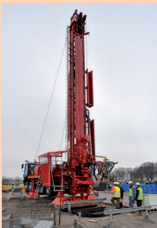
Mit dieser Anlage wurde die TEWS eingebaut.

Die Arbeiten fanden tagsüber zu den üblichen Arbeitszeiten im zukünftigen Innenhof der Überbauung der Baugenossenschaft Sonnengarten statt und dauerten zwei Wochen.